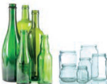
Bouteilles, pots et bocaux