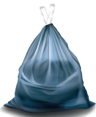
Déchets à mettre dans un sac fermé